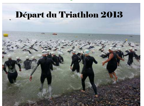
Départ du Triathlon 2013