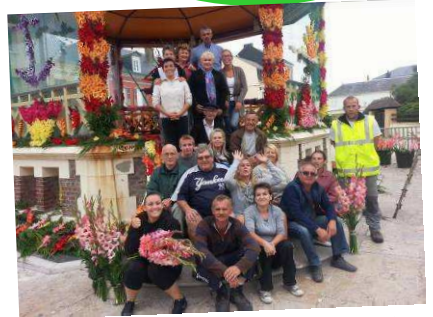
Merci à ceux qui ont décoré le kiosque pour la fête des fleurs

A ce jour, notre tâche n'est pas terminée : dès à présent, nous travaillons à la mise en place de la saison 2014, espérant vous retrouver l'année prochaine... Bonne rentrée à tous & que vive Cayeux-Sur-Mer !!!