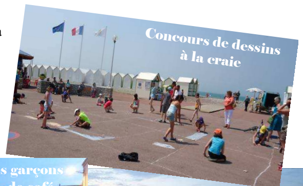
Concours de dessins à la craie