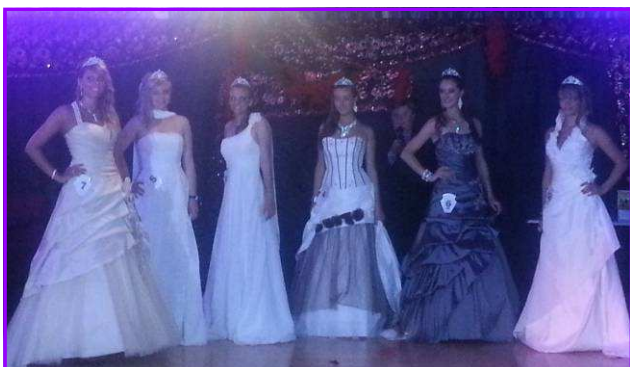
Élection de Miss Cayeux au Casino de Cayeux-sur-Mer