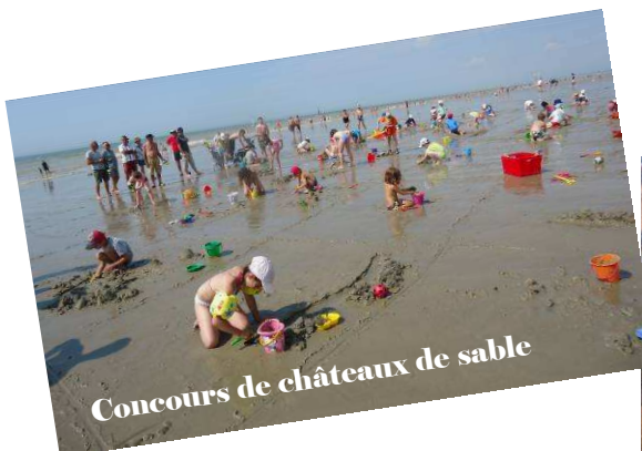
Concours de châteaux de sable