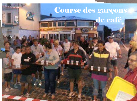
Course des garçons de café